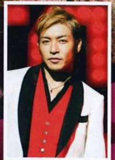
【ゲスト】 将棋親善大使 つるの 剛士

Cherry blossoms Festival Night and Day in TENDO