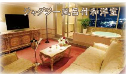
ジャグジー風呂付和洋室