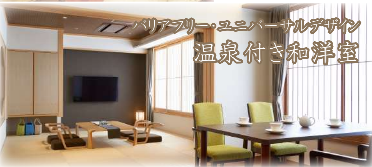
バリアフリー・ユニバーサルデザイン 温泉付き和洋室